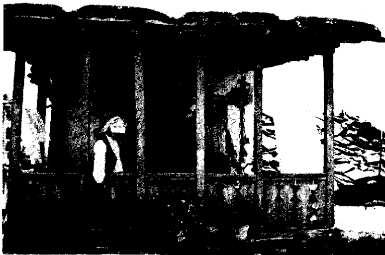
و زندگی ادامه دارد

نوع سینما صدمه وارد ساخته است. اکنون باید به تقویت این نوع فرهنگ در صنعت سینمای مستند کشور پرداخت.