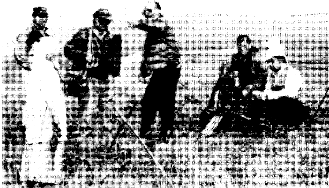
پشت صحنه درخت جان

○ - نگاه من به سینما و آنچه بیش تر در درخت جان عینیت یافته، از نظر من تعریف روشنی ندارد، ولی معتقدم که تلاش این نوع سینما، کشف قابلیت‌های این هنر و رسیدن به عرصه‌های جدیدی از بیان است. سینمای تجاری ما امروزه دارد از ناحیه ضعف و کم خونی خودش ضربه می بیند و دچار خسارت می شود. عدم توجه این سینمای تجاری به گستردگی زبان سینماست که سبب این ضعف و کم خونی شده است. سینمای متفاوت و فارغ از دغدغه گیشه است که می تواند در راه کشف آن قابلیت‌ها گام بردارد. در این کار نه به قصد تقلید و نگاه به تجربیات انجام شده، بلکه به قصد تبعیت از ندای قلبی خودم دست به کار شدم. اگر حسی را شما در این فیلم دریافت می کنید، به نوعی تبلور تصور و تخیل خود من برای روایت این گونه مضامین مورد نظرم بوده است. و از آنجاکه معتقدم سینما بیش از هنرهای دیگر به شعر نزدیک است و خود من احساس می کنم که در این چهارچوب بیش تر خودم هستم. پس بیان و فضای فیلم متأثر از این نحوه تخیل و تفکر من شده است. ... - در این فیلم گذشته طالش را نشان داده‌اید و آنچه را که به ارزش‌های کهن زندگی آن مردم و منطقه بر می گردد در حالی که در مستندهای قبلی‌تان، وضع کنونی آن منطقه و مردمش را نمایانده‌اید. آیا می توان در آینده فیلم دیگری (مستند سینمایی) را از شما انتظار کشید، که در آن مردان سوار بر مرکب‌های آهنین، کوهستان‌های طالش را پشت سر بگذارند، در حالی که لباس‌های امروزی به تن دارند و...؟